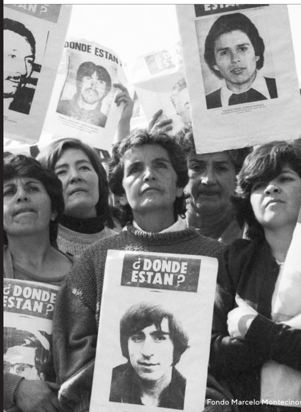
Fondo Marcelo Montecinos