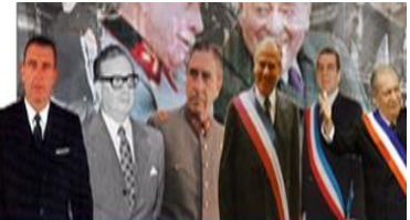
Presentación - Transición a la Democracia en Chile